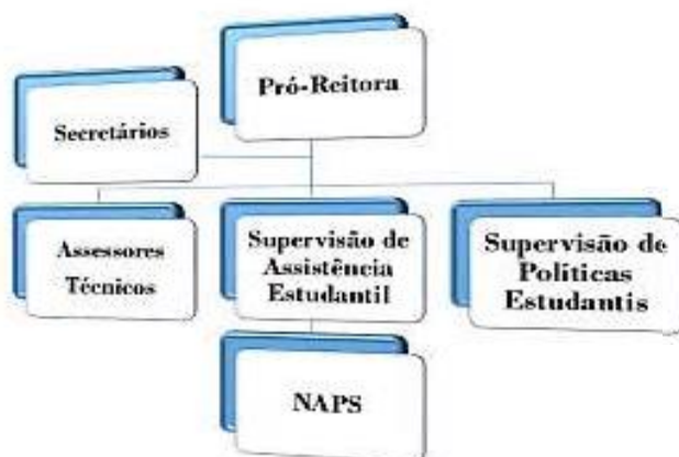
Figura 3. Organograma da Pró-Reitoria Estudantil